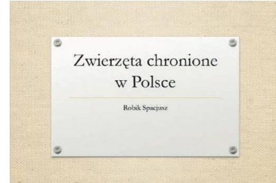
Rys 1. Slajd tytułowy

7) Pracę zapisz jako prezentację programu PowerPoint pod nazwą Kozica .