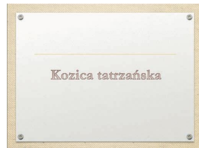
Rys 1. Slajd 2